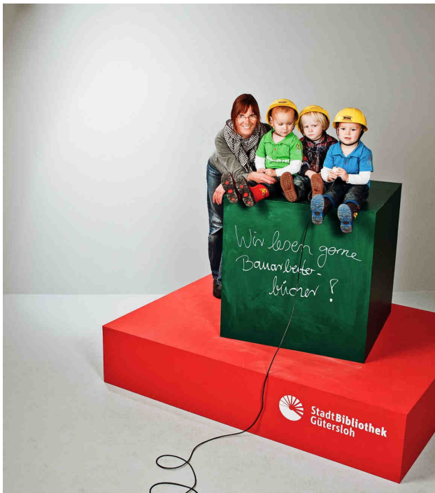
„Wir lesen gerne Bauarbeiterbücher!“

derbeschaffungswertes und bleibt bis auf weiteres konstant.