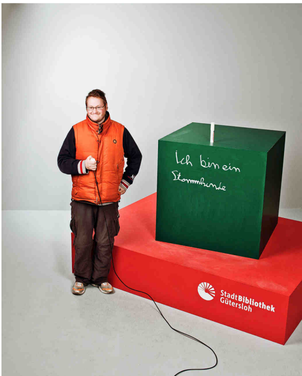
„Ich bin ein Stammkunde.“

Für Bibliothekskunden, die ihren eigenen Rechner mitbringen, steht ein drahtloser Internetzugang per WLAN bereit.