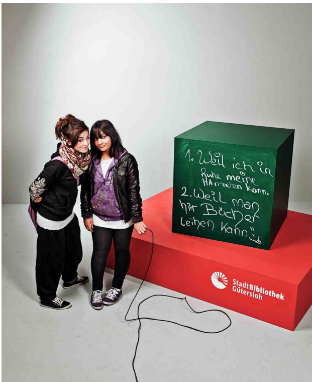
„1. Weil ich in Ruhe meine Hausaufgaben machen kann. 2. Weil man hier Bücher leihen kann.“

Der Sommerleseclub wurde durch die Stadtwerke und die Sparkasse Gütersloh gesponsert. Die Federführung des Sommerleseclubs liegt seit 2005 beim Kultursekretariat NRW in Gütersloh. Außerdem ergänzt der Sommerleseclub das Landesprojekt „Kultur und Schule“ und wird aus diesen Mitteln gefördert.