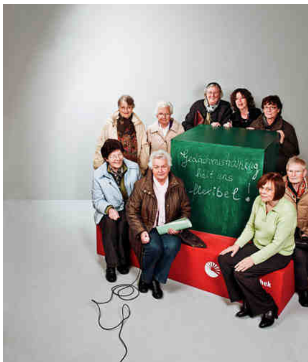
„Gedächtnistraining hält uns flexibel!“