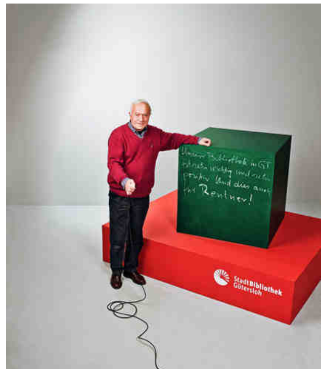
„Unsere Bibliothek in GT ist sehr wichtig und sehr positiv. Und dies auch für Rentner!“