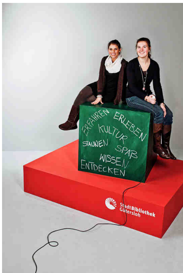
Tabelle 1: Produktbereiche

„Erfahren – Erleben – Kultur – Staunen – Spaß – Wissen – Entdecken“