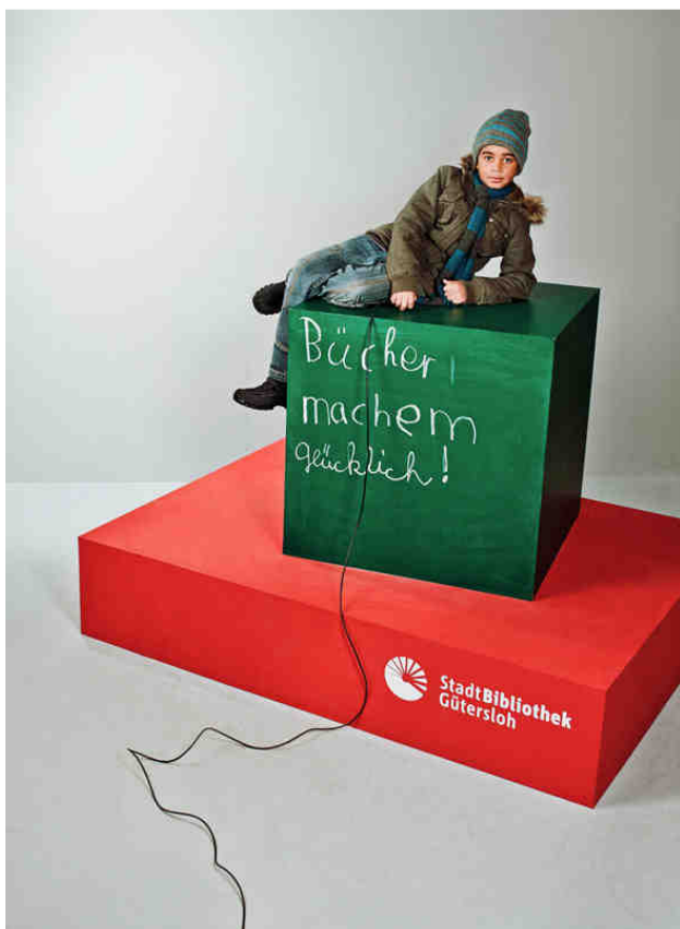
„Bücher machen glücklich!“

Der Beitrag der Stadtbibliothek zur sozialen Integration wird deutlich, wenn man den Anteil der Gütersloher Einwohner mit Stadtpass (2010: rd. 6.950 = 7,2%) dem Anteil der erwachsenen Bibliothekskunden mit ermäßigten