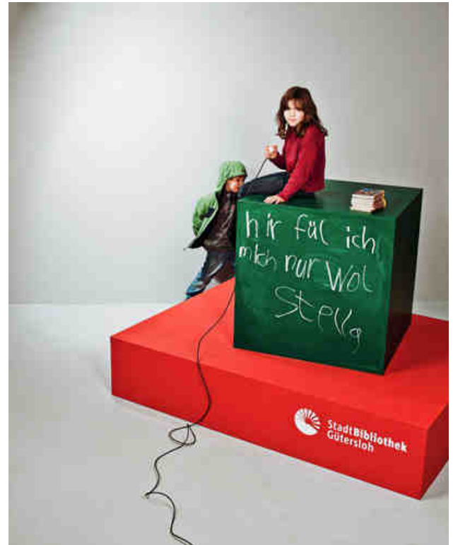
„hir fül ich mich nur wol.“

Im November und Dezember wurde die Werbekampagne „Meinungsbilder“ gestartet. Ziel war es, der Bibliothek auch nach außen ein Gesicht zu geben. Besucher konnten Statements zur Stadtbibliothek auf einen großen grünen Würfel schreiben und sich selbst mit ihrem Kommentar per Selbstausröser fotografieren. Entstanden sind 135 „Meinungsbilder“, die einen glaubwürdigen Eindruck von der Wertschätzung der Gütersloher für ihre Bibliothek vermitteln. Entstanden ist die Idee in Zusammenarbeit mit dem Fotografen Detlef Güthenke und der Vorsitzenden des Literaturvereins, Elke Corsmeyer. Der Literaturverein hat das Projekt auch finanziell unterstützt. Die Bilder können nun zur Eigenwerbung der Bibliothek genutzt werden, so z. B. auf der Website und innerhalb des Facebook-Auftritts.