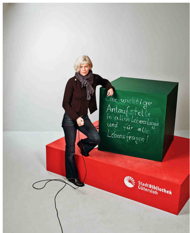
„Eine wichtige Anlaufstelle in allen Lebenslagen und für alle Lebensfragen!“

Im Rahmen verschiedener Projekte wurden in den vergangenen Jahren verschiedene „Themen-Bibliotheken“ für besondere Zielgruppen bzw. besondere Lebenslagen eingerichtet und in den Routine-Betrieb übernommen, zuletzt das Ende 2006 eingerichtete Themenfeld „Generation plus“.