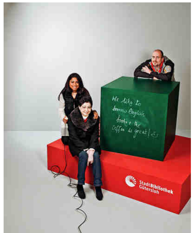
„We like to borrow English books and the coffee is great!“

Das fremdsprachige Angebot der Stadtbibliothek umfasst rund 2.100 Medien (davon 300 für Kinder) und mehrere Zeitschriften-Abonnements.