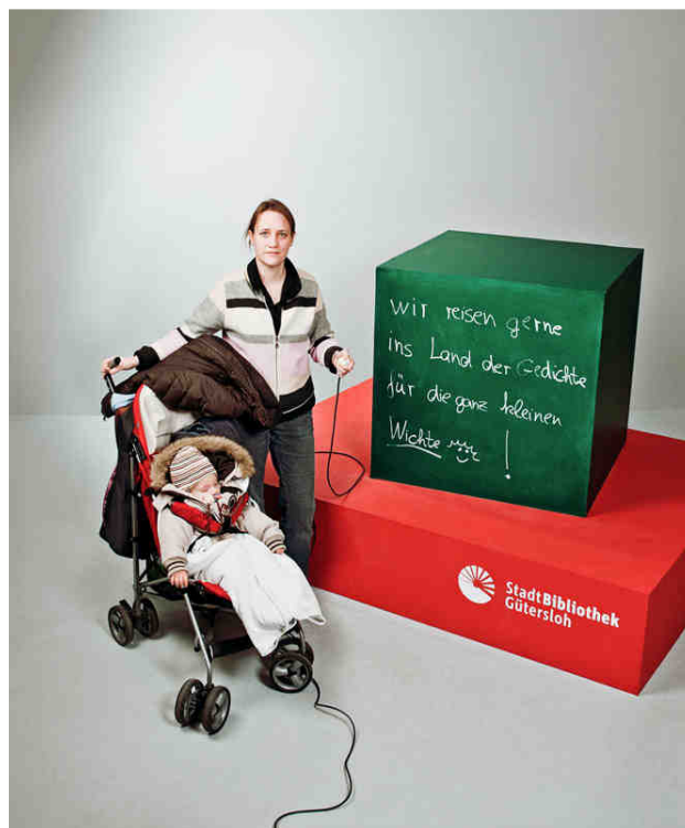
„Wir reisen gerne ins Land der Gedichte für die ganz kleinen Wichte!“

Parallel dazu werden Kontakte zu den Gütersloher Tageseinrichtungen für Kinder und den Grundschulen gepflegt, die ein entsprechendes Angebot vorfinden (Führungen, Teilnahme an Autorenlesungen, Medienkisten etc.).