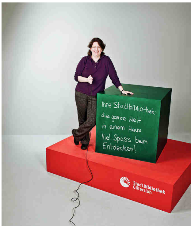
„Ihre Stadtbibliothek: die ganze Welt in einem Haus. Viel Spaß beim Entdecken!“