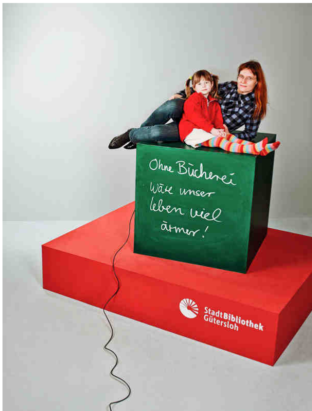
„Ohne Bücherei wäre unser Leben viel ärmer!“

Die Finanzplanung 2012 bis 2014 ist Bestandteil des Leistungs- und Wirtschaftsplans 2011 und wurde in diesem Rahmen vom Bildungsausschuss beraten und vom Rat der Stadt Gütersloh am 25.03.2011 verabschiedet. Es bleibt damit bei den bereits im März 2010 beschlossenen Kürzungen für diesen Zeitraum. Dies betrifft insbesondere das Planjahr 2014 mit einer weiteren Reduktion um 321,7 T€ gegenüber 2013.