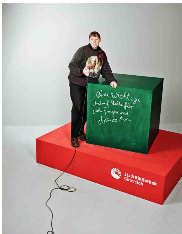
„Eine wichtige Anlaufstelle für viele Fragen und Antworten“

In den letzten Jahren wurde die Zahl der Beratungen durch jeweils drei bis vier einwöchige Stichproben erhoben. Diese Zahlen waren sehr ungenau, die Auswertung relativ arbeitsaufwendig. Da die personellen Ressourcen nicht mehr zur Verfügung stehen, werden diese Stichproben inzwischen nicht mehr erhoben.