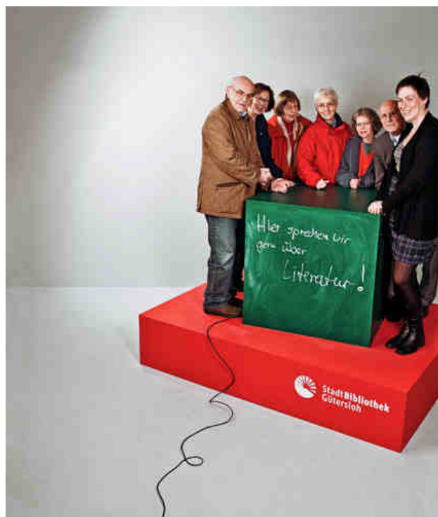
„Hier sprechen wir gern über Literatur!“

Der Literaturverein organisierte eine Lesung mit der norwegischen Autorin Anne B. Ragde. Darüber hinaus war die Stadtbibliothek Veranstaltungsort für eine Lesung mit Helene Tursten, die im Rahmen der Krimireihe „Bei Lesung Mord“ der Buchhandlung Markus stattfand.