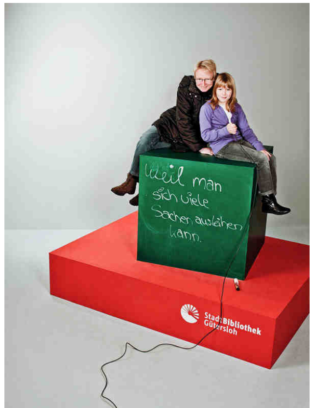
„Weil man sich viele Sachen ausleihen kann“

Im Berichtsjahr wurden insgesamt 21.205 verschlissene bzw. veraltete Medien ausgesondert (Vorjahr: 16.770), damit der Bestand aktuell bleibt und ansprechend aussieht. Die Löschungen waren auch eine Vorbereitung auf die Einführung der Selbstausleihe. Es sollten keine veralteten Medien mit einem RFID-Chip ausgerüstet werden.